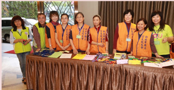
本會的工作人員總是熱情的為會員們服務！

106年11月18日是新北市空大校友會第五屆第二次的會員代表大會，也是我來到校友會第二次參與的會員大會；會議中，理事長以輕鬆談諧方式帶動全場，在溫馨感性氣氛中進行，個人參加過無數場的大會，今日坐在台下聆聽的感覺，心情非