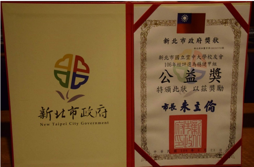
◆本會榮獲新北市政府頒發人民團體「公益獎狀」