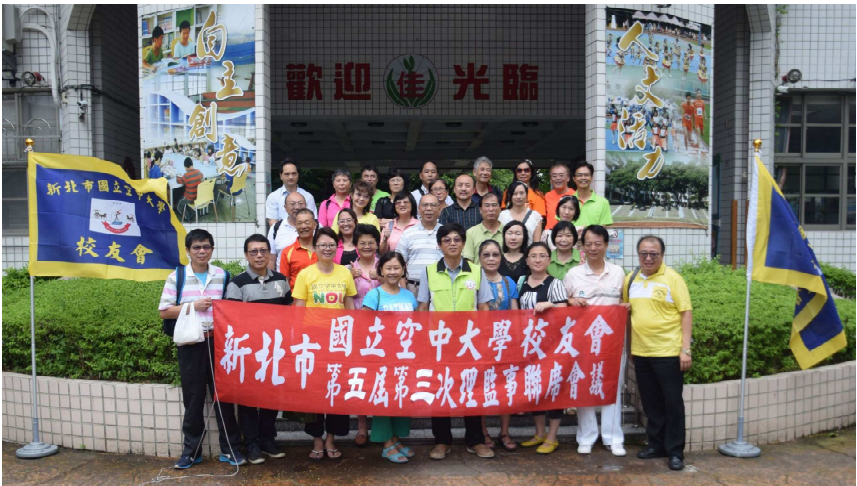
第三次理監事聯席會議圓滿結束合影留念