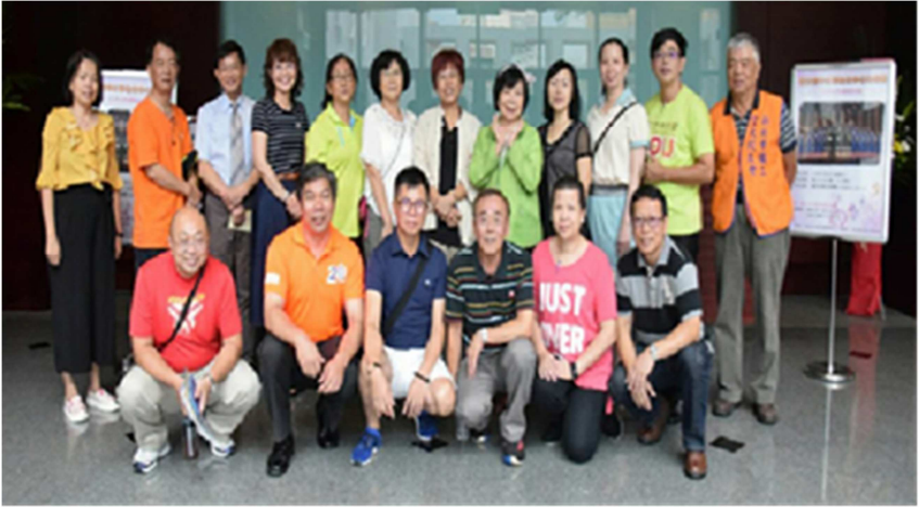
本會協辦合唱團演出參與的工作人員合影留念