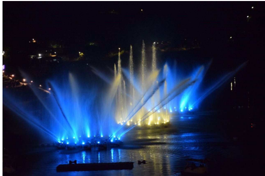
106.03.18 碧潭水舞秀 更多照片在 LINE 群組