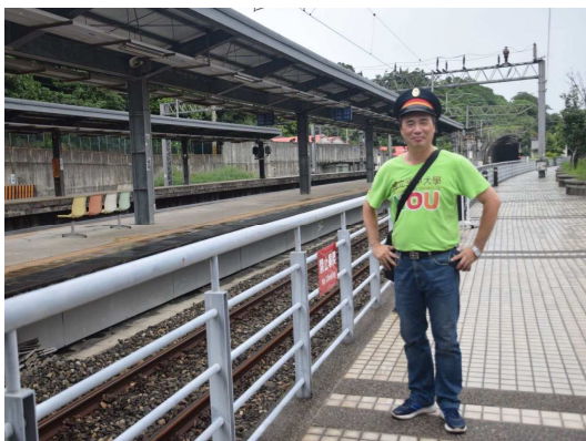
106.07.29 回味百年車站-山佳風華 更多照片在 LINE 群組

剛進小一的小蘿蔔頭最可愛，但是卻讓我花最多心力，他們是常被告狀的一群，「老師，他上廁所沒關門。」啊呀！這不是家裡，這是公共場所，我就要苦口婆心的一再交代。有時他們也會脫口而出叫：「媽，我跟你說」，或者像跟屁蟲般拿著本子跟著我上廁所，「這怎麼寫？」。或者說一些啼笑皆非的話，「我昨天晚上睡覺時有看到妳」「我在幹嘛？」「妳在改作業啊！」或者小男生不知如何尿尿，灑到褲子，又被告狀：老師，他很臭。更麻煩的有一位長得眉清目秀的小男生，腸道過動，有時不知不覺就把屎拉出來，在校時老師會請家長處理，可是在課輔班我儘量不麻煩家長，因為體諒他們忙碌，我一邊安撫他也一邊告誡其他同學勿取笑他。、、、這