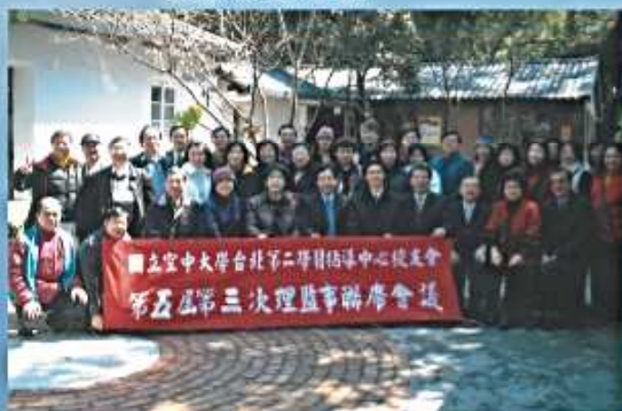
94.03.06 第5屆第3次理監事會議 (碧瑤山莊)