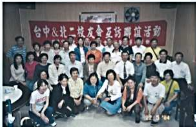
93.05.22 與台中校友會東勢林場八仙山之旅聯誼活動