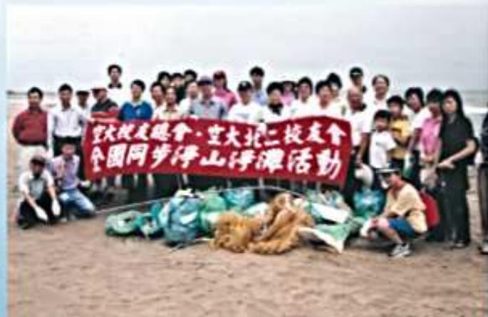
93.06.20 第4屆第8次理監事會議暨淨灘活動(三芝淺水灣)