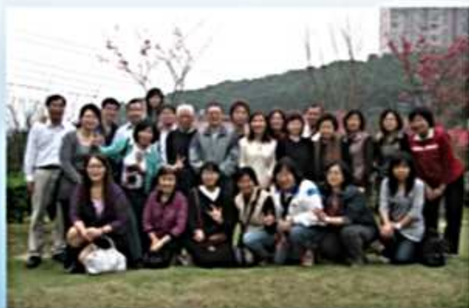
98.02.15新春團拜(小坪頂田園村餐廳)