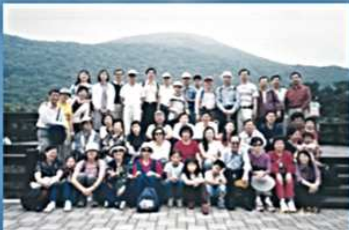
90.04.29陽明山蝴蝶花廊步道健行