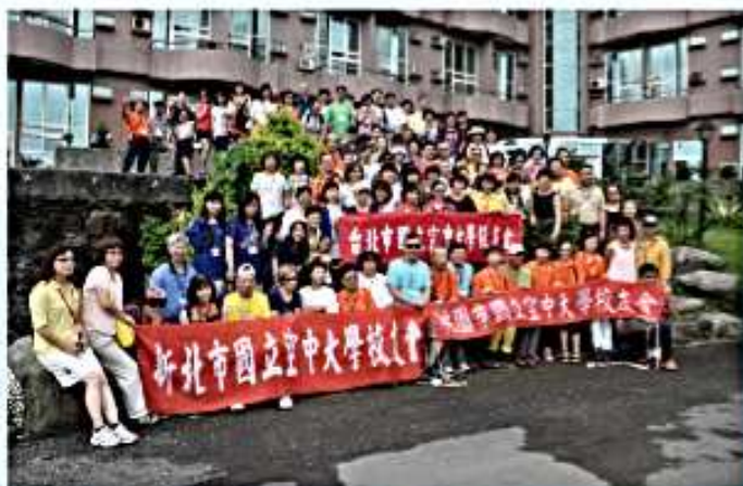
104.06.06 北區五校友會春季聯誼旅遊 (北橫、九寮溪之旅)