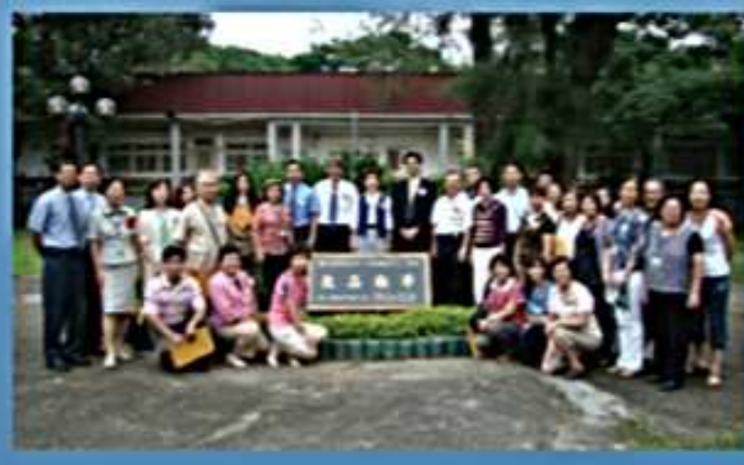
97.08.03 第6屆贈送母校紀念品 --崗石扁額