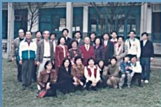
87.03.21 春之饗宴--美化中心植樹活動