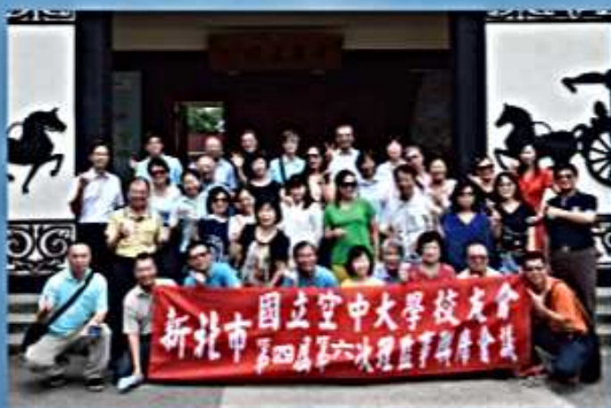
105.07.17 第4屆第6次理監事會議 (蘆洲空大台北中心)