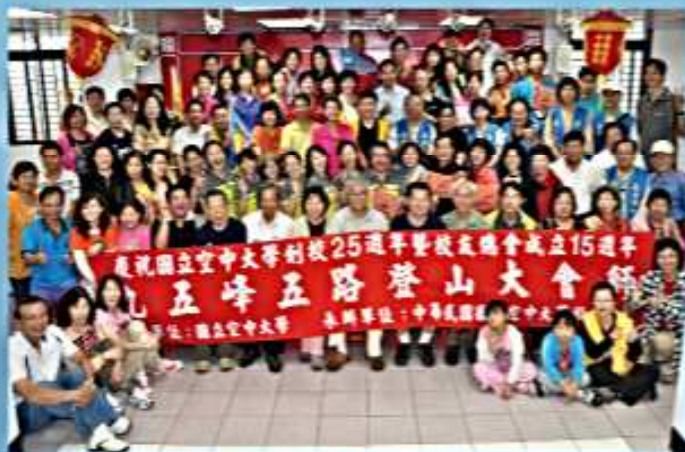
100.10.02 空大25週年校慶--九五峰五路 登山大會師