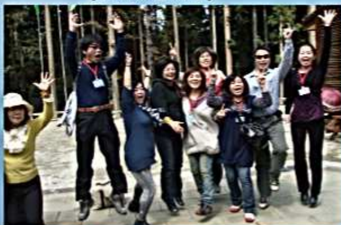
100.03.12-13 北區校友會春季旅遊 (溪頭之旅)