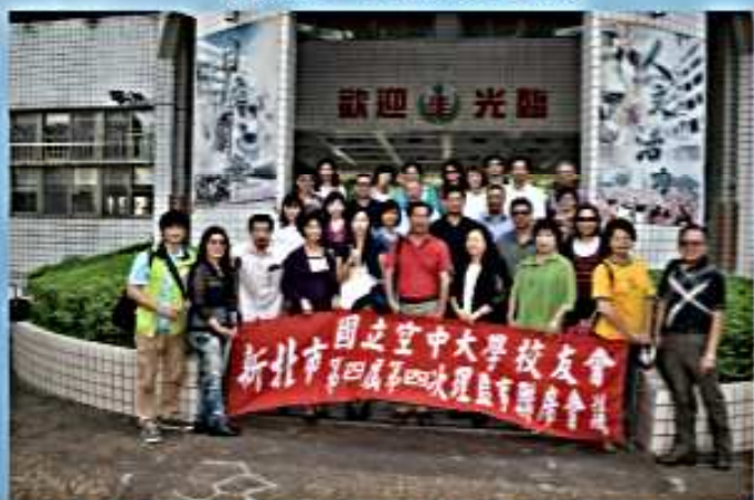
104.10.25 第4屆第4次理監事會議 (樹林山佳國小)