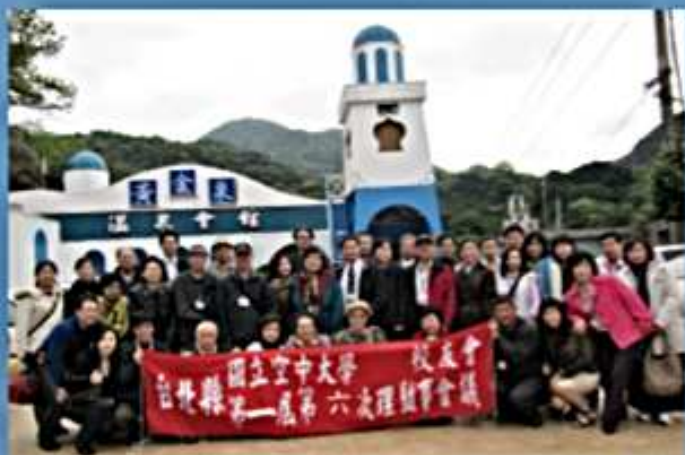
99.03.04 第1屆第6次理監事會議 (北投黃金溫泉會館)