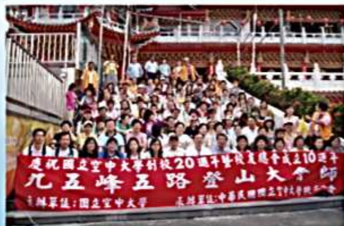
95.10.29 空大20週年校慶--九五峰五路 登山大會師