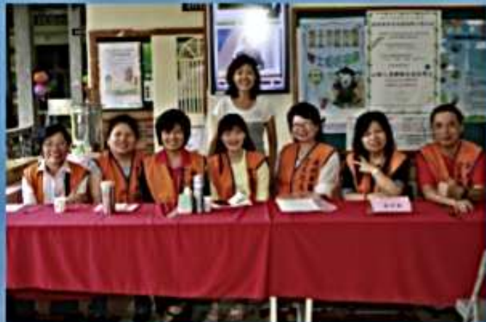
101.06.02 空大新北100學年度下畢業生 聯誼會校友服務