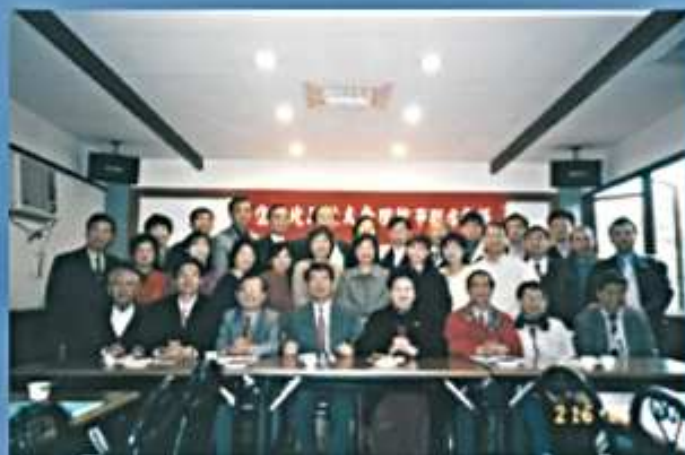
92.02.16 第4屆第3次理監事會議 暨新春團拜(新莊得茗茶宴)