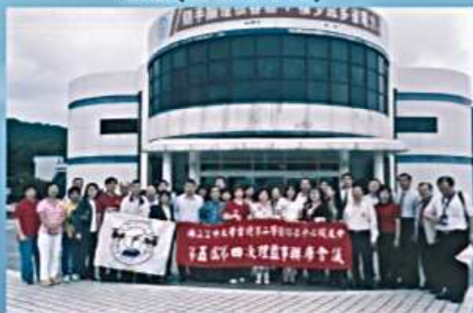
94.05.29 參觀台電公司第二核能發電廠