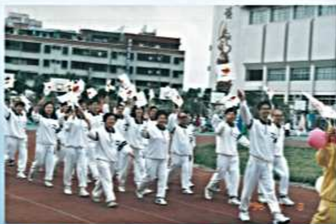
85.11.03 空大10週年校慶運動大會 「北二校友隊」出場