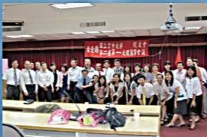
99.10.10 第2屆第1次理監事會議 (空大五樓國際會議廳)