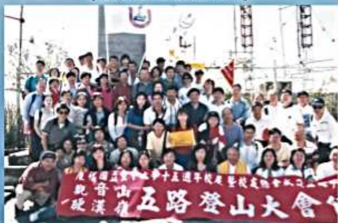
90.10.20 空大15週年校慶觀音山硬漢嶺 五路登山大會師