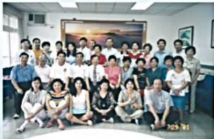
90.07.29 第3屆第6次理監事會議 (陽明山馬槽招待所)