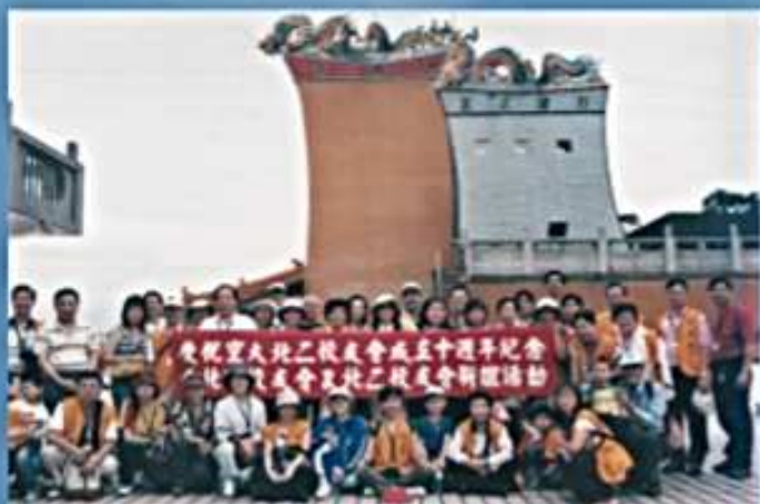
95.05.20 與台北校友會「軍艦岩、情人廟健行」聯誼活動