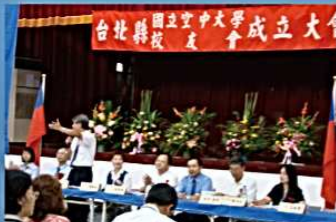
97.08.03 台北縣國立空中大學校友會 成立大會(空大中正堂)