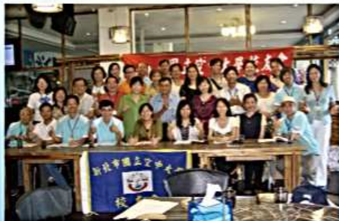
102.06.01 第3屆第3次理監事會議 (八里巴黎灣景觀餐廳)