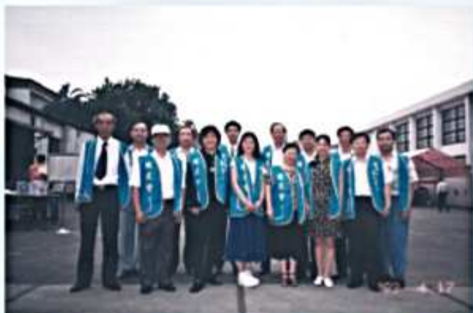
88.04.17 空大87學年度上學期畢業典禮 服務