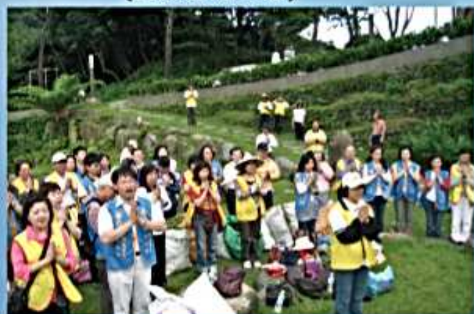
98.05.03 第1屆第3次理監事會議 (法鼓山出坡淨山活動)