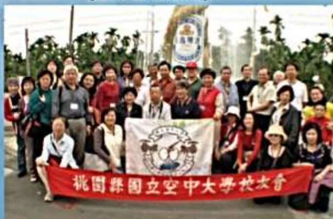
96.03.17-18 北區校友會春季旅遊 (南台灣二日遊)(青島啤酒)