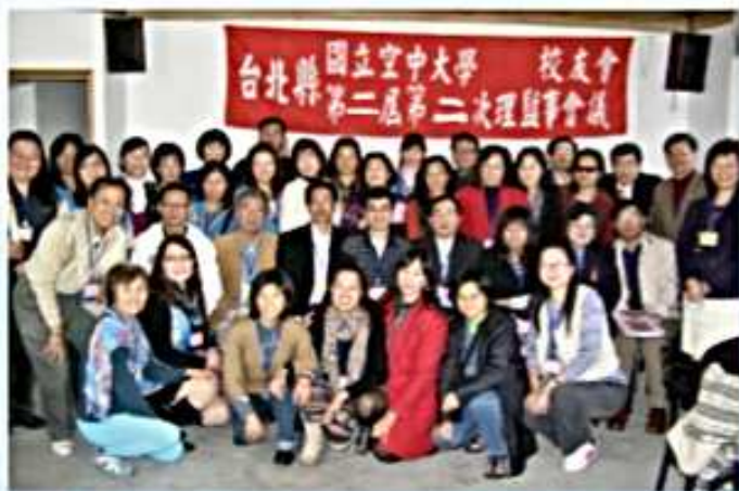
99.12.19 第2屆第2次理監事會議 (士林禾豐農園)