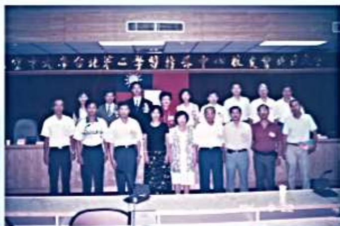
85.09.22 第1屆成立大會校友合影