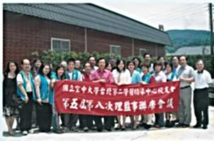
95.06.11 第5屆第8次理監事會議 (士林客官農場)