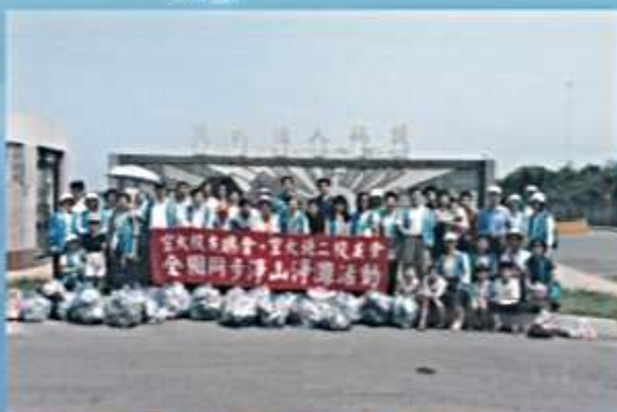
91.05.26 全國同步淨山淨灘活動 (淡水漁人碼頭)