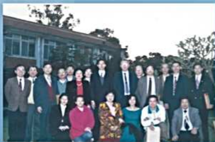
85.12.14 第1屆第2次理監事會議 (台灣省家畜衛生試驗所)