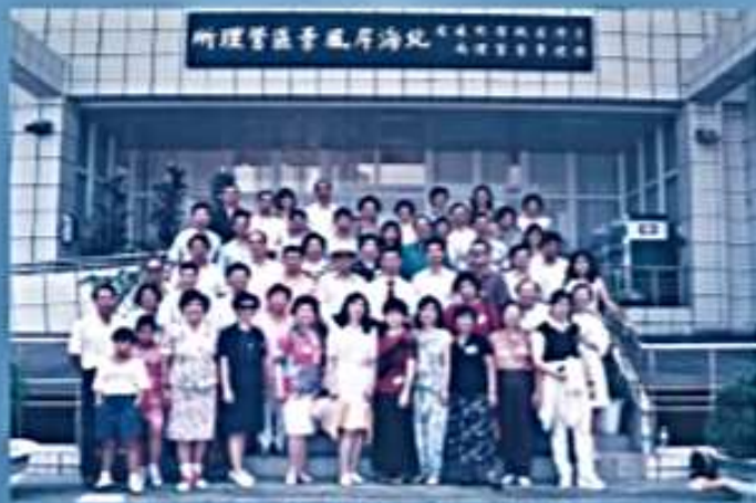
87.08.02 與台北校友會「北海逍遙遊」 聯誼(北海岸風景區管理處)