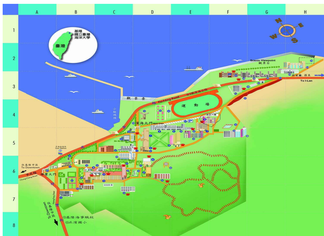
圖表 5 空大基隆中心校區導覽圖

火車：搭乘往基隆的任何種類的火車(請勿搭上北迴線的火車，因北迴線的火車不經過基隆)。