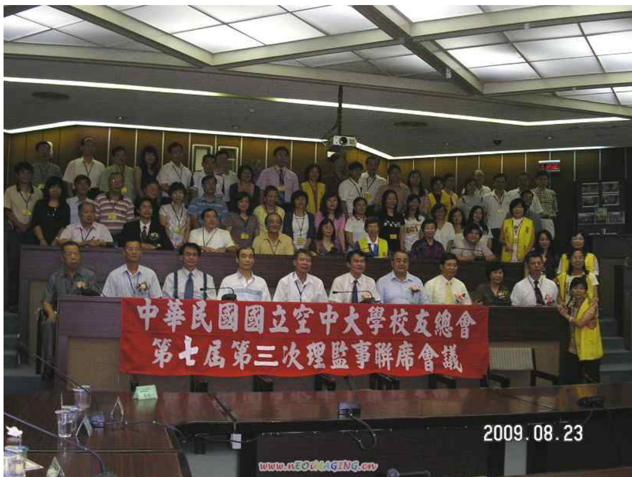
圖表 3 校友總會 7-3 理監事聯席會議(09.823)基隆