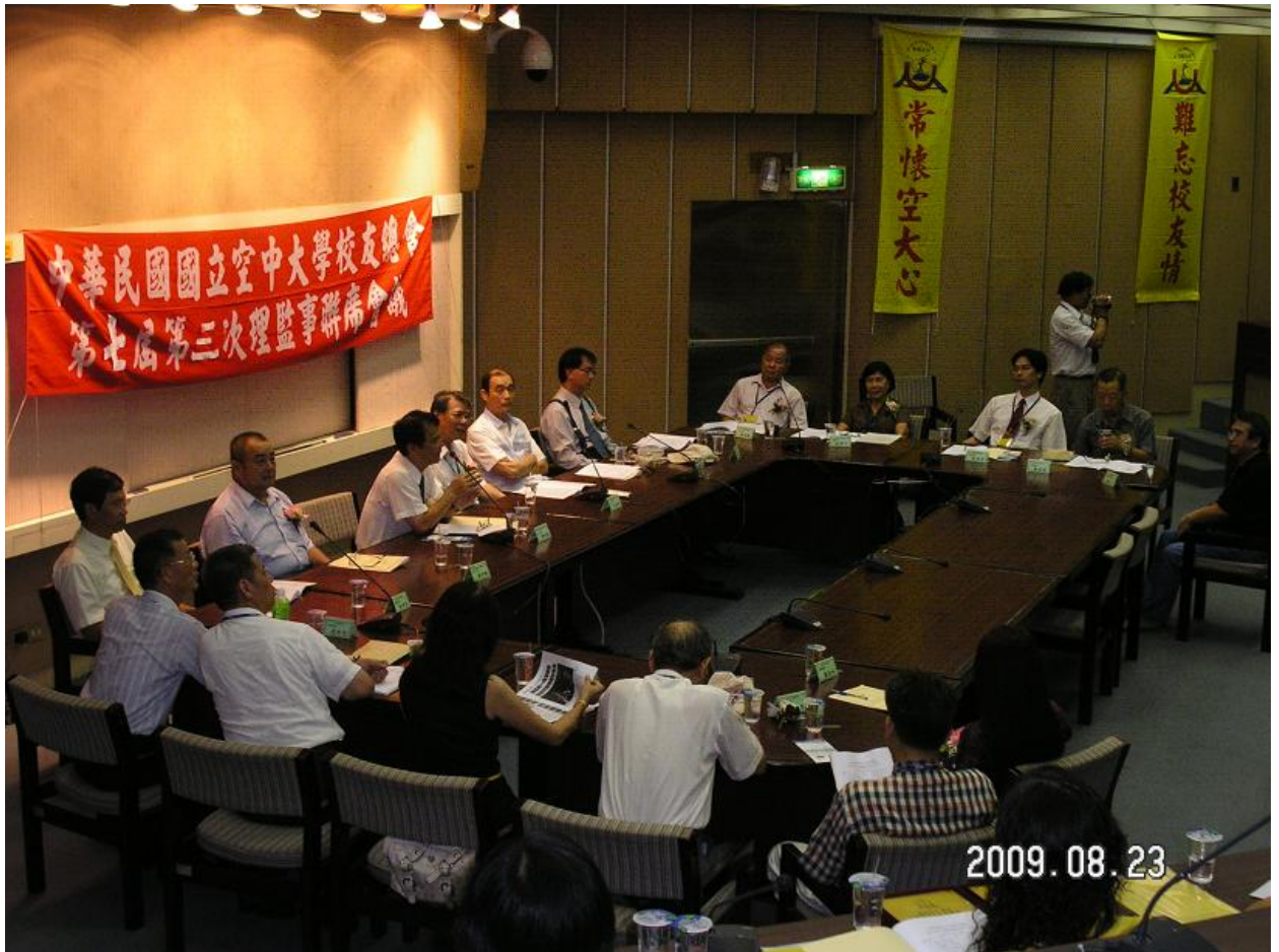
圖表 4 理監事聯席會議議場實況